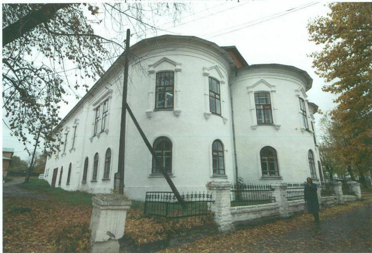
Фото 1. «Воскресенская церковь», Кировская область, г. Уржум, ул. Советская, д. 19. Дата – 02.10.2014.