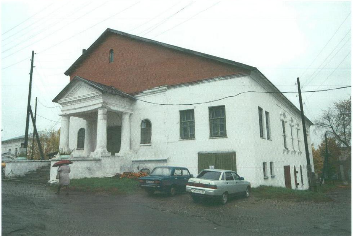
Фото 4. «Воскресенская церковь», Кировская область, г. Уржум, ул. Советская, д. 19. Дата – 02.10.2014.