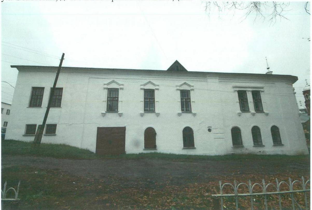
Фото 3. «Воскресенская церковь», Кировская область, г. Уржум, ул. Советская, д. 19. Дата – 02.10.2014.