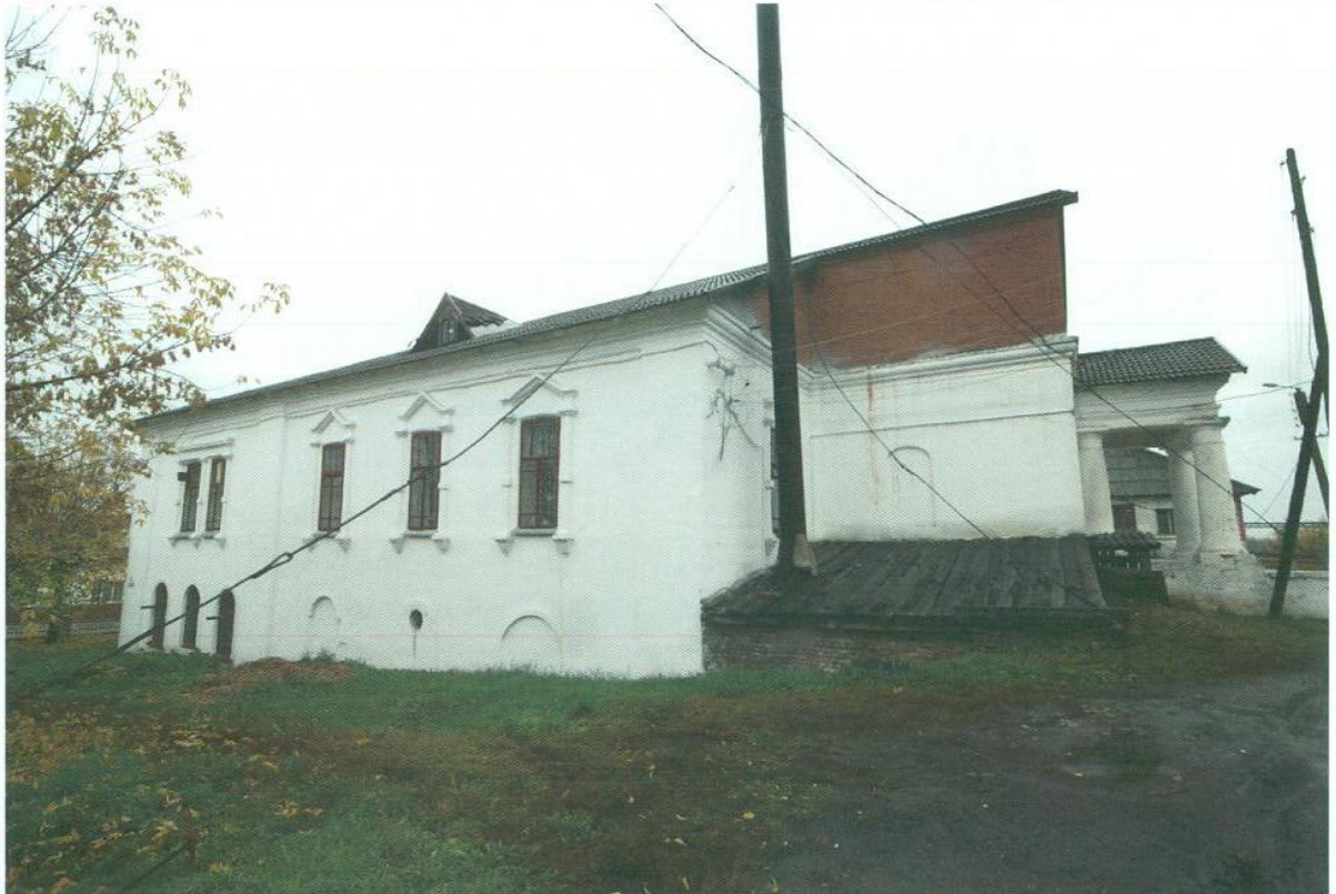
Фото 2. «Воскресенская церковь», Кировская область, г. Уржум, ул. Советская, д. 19. Дата – 02.10.2014.