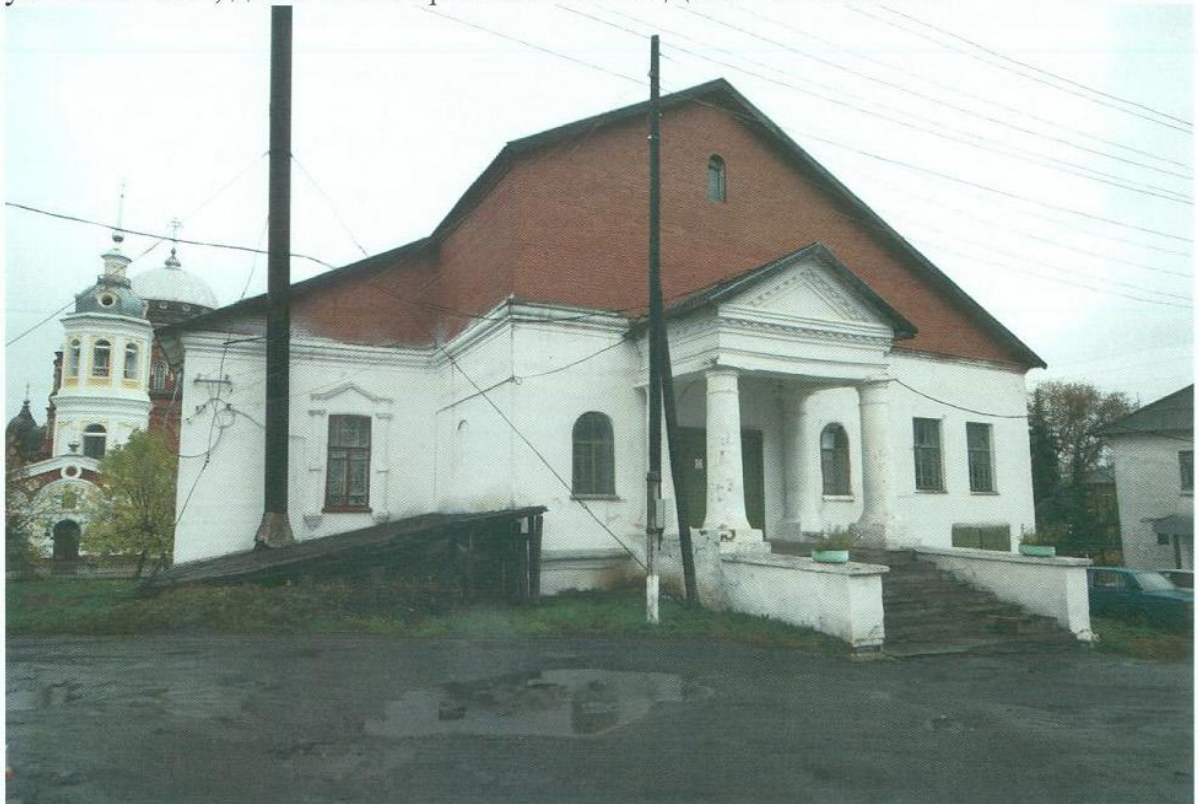
Фото 5. «Воскресенская церковь», Кировская область, г. Уржум, ул. Советская, д. 19. Дата – 02.10.2014.